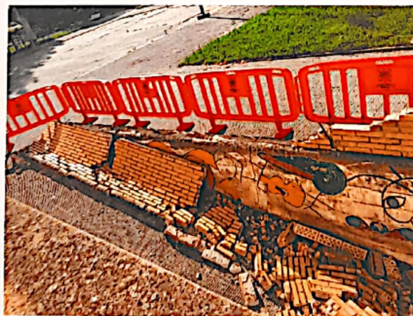
2020ko ekainean egindakoa.