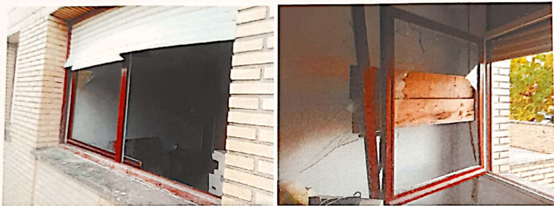
Urriak 18ko apurketa.